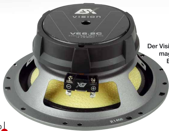
Der Vision-16er ist mit einem dicken Ferritmagneten sowie einem gepulverten Blechkorb ausgestattet

Das bisherige Vision-Set hielt sich rekordverdächtig lange im Lieferprogramm, und das aus gutem Grund. Jetzt schickt sich ESX an, einen Nachfolger zu den Händlern zu schicken.