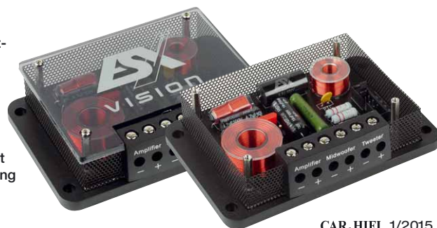
Die edle Frequenzweiche bietet neben einer guten Bauteilbestückung die Möglichkeit zur Mittenanpassung