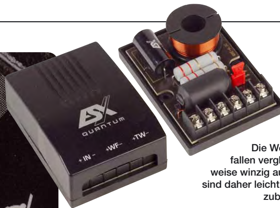
Die Weichen fallen vergleichsweise winzig aus und sind daher leicht unterzubringen

leren Preisbereich angesiedelt, und hebt sich mit seinen Features dann auch deutlich vom Einsteigerbereich ab. Auf den ersten Blick zu erkennen ist der stämmige Tieftöner, aber auch der Hochtöner gibt sich als hochwertiges Modell zu erkennen. Zwar handelt es sich um eine 25 Millimeter Gewebekalotte, die am weitesten verbreitete Bauart zumindest bei Markenprodukten, doch sieht man sich den Gewebedom genauer an, fällt auf, dass hier