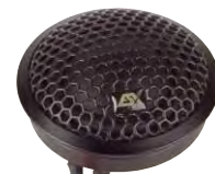
Der Hochtöner im Metallgehäuse ist ein echtes Sahneteil mit ausgedehntem Frequenzgang

Das QXE6.2Cv2 gehört zu den wenigen Systemen, die unseren Messparcours ohne Fehl und Tadel durchlaufen. Hier stimmt wirklich alles, angefangen bei der sehr großzügigen Parametrie des Tieftöners mit jeder Menge Antrieb und Wirkungsgrad. Auch der Amplitudenfrequenzgang zeigt sich von der besten